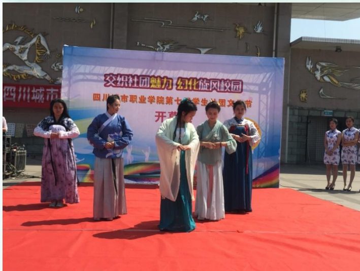
学生展示传统礼仪