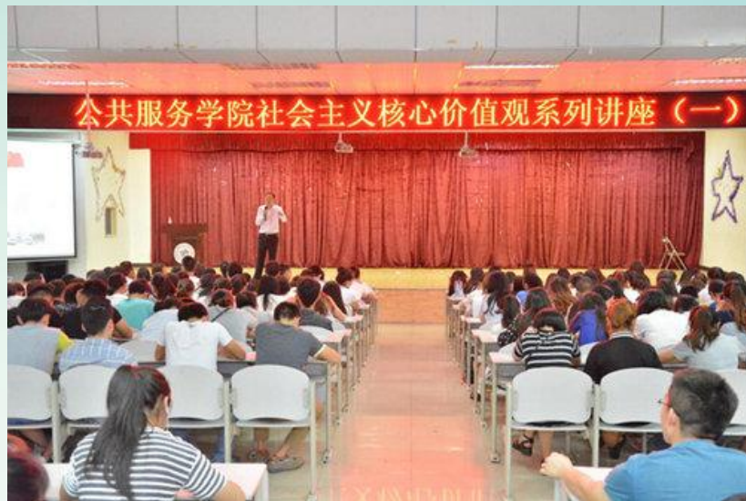
开展核心价值观系列讲座