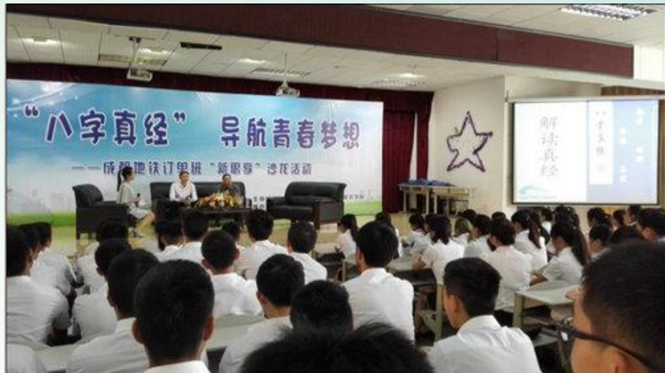
开展八字真经讲座