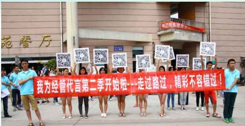
微信开展“最具人气教师”评选活动